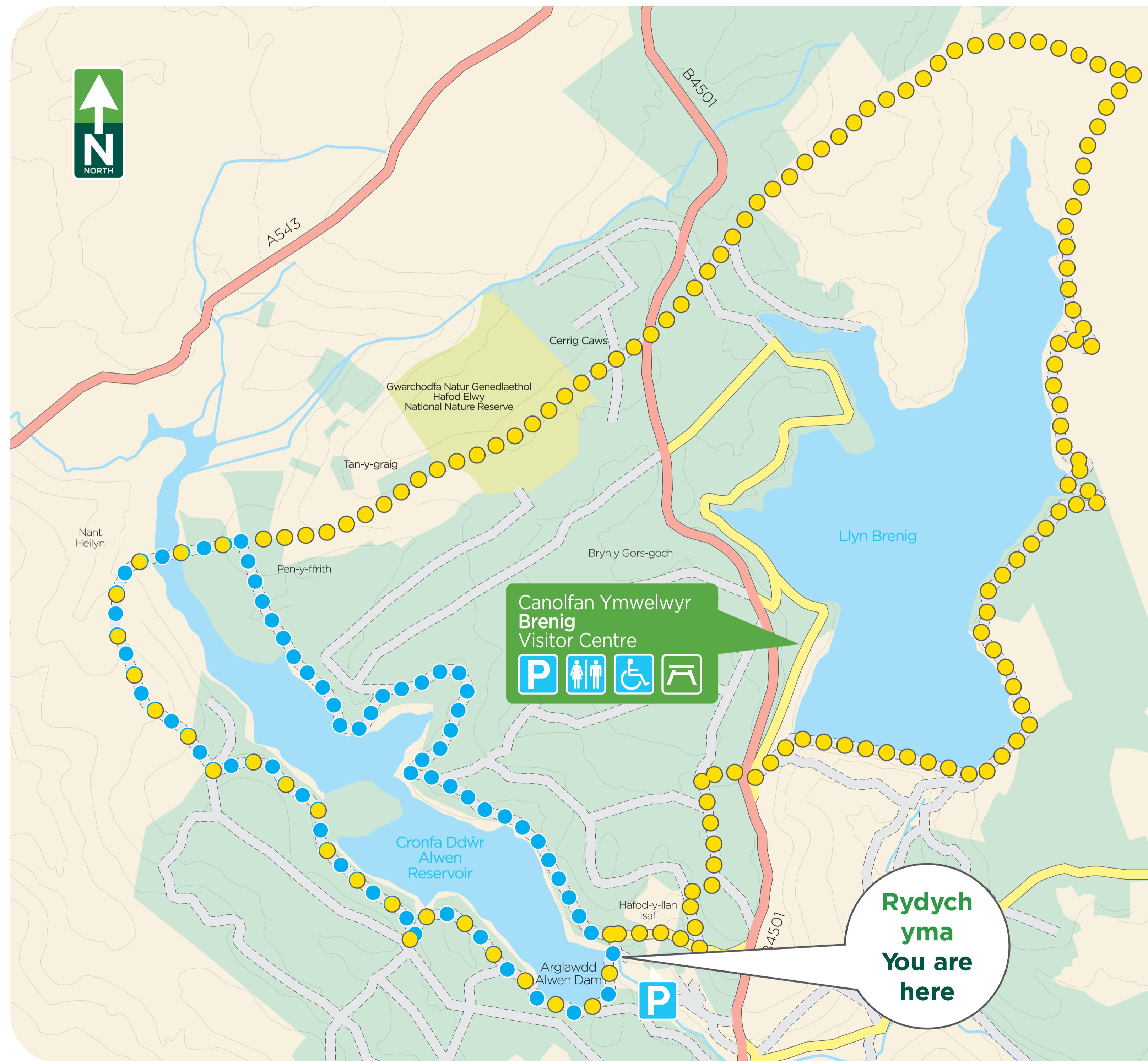
Atgynhyrchir y map hwn o Ddeunydd yr Arolwg Ordnans gyda chaniatâd Arolwg Ordnans ar ran Rheolwr Llyfrfa Ei Mawrhydi: Hawflraint y Goron. This map is based upon Ordnance Survey material with the permission of Ordnance Survey on behalf of the controller of Her Majesty's Stationery Office

Os byddai'n well gennych daith gerdded hirach, bydd Llwybr y Ddau Lyn yn mynd â chi o amgylch Cronfeydd Alwen a Brenig.