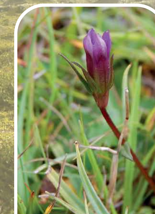
Crwynlys y twyni Dune gentian

The very rare beachcomber beetle (or 'strandline' beetle) shelters under driftwood on the beach and looks out for a favourite snack - sandhoppers.