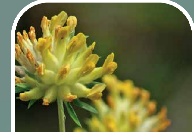
Plucan Kidney vetch