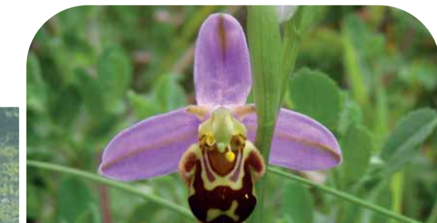
Tegeirian gwenynog Bee orchid