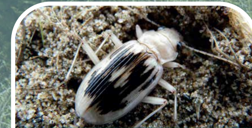
Chwilen broc môr Beachcomber beetle