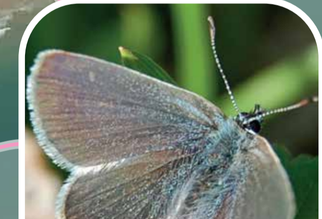
Y glesyn bach Small blue butterfly

Venture onto the cockle shell-covered path which winds through the dunes, and where ponies graze all year around.