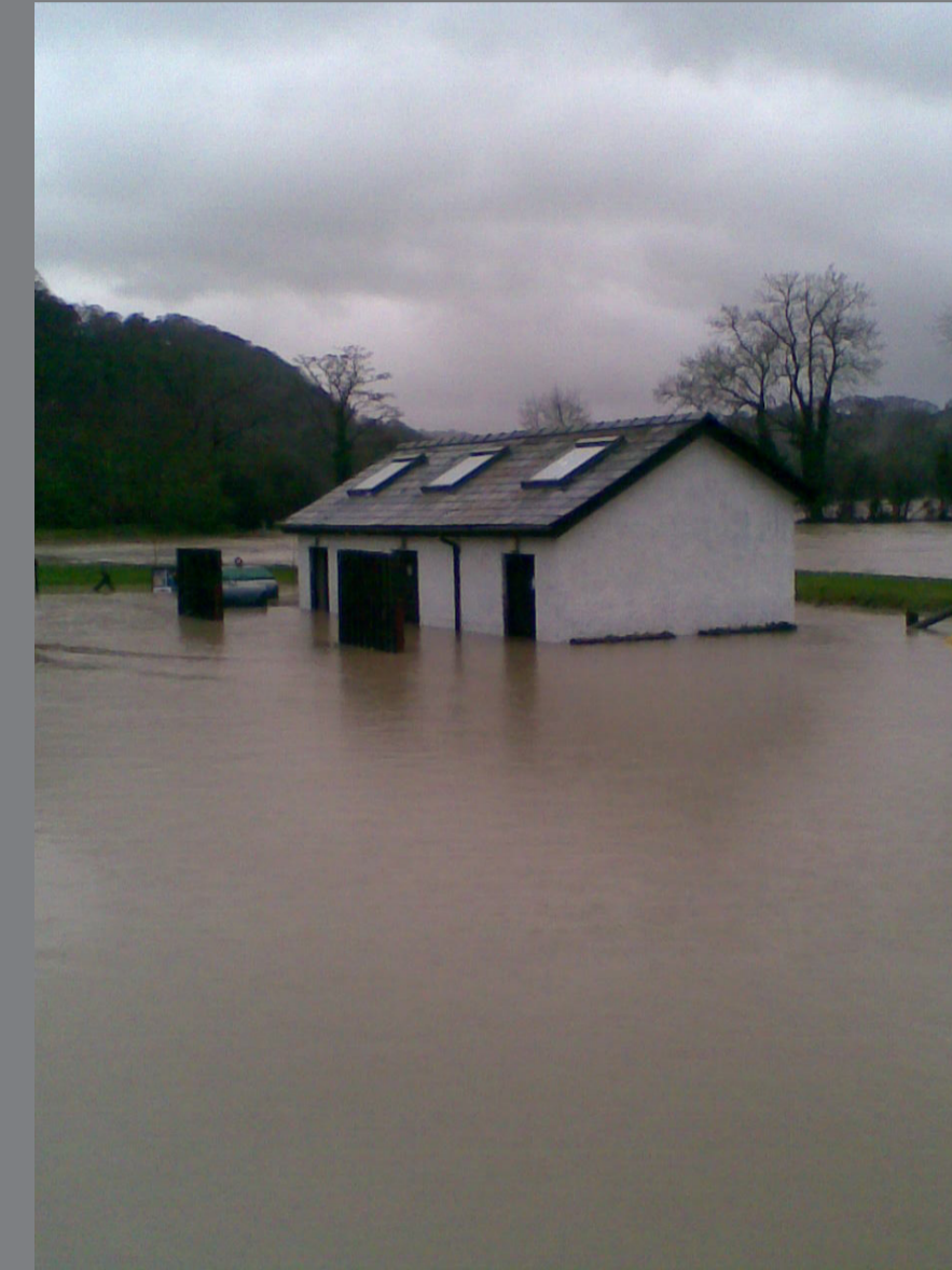
Ffotograffau o'r llifogydd yn Llanfair Talhaearn, Tachwedd 2012. Photographs of flooding in Llanfair Talhaiarn, November 2012.