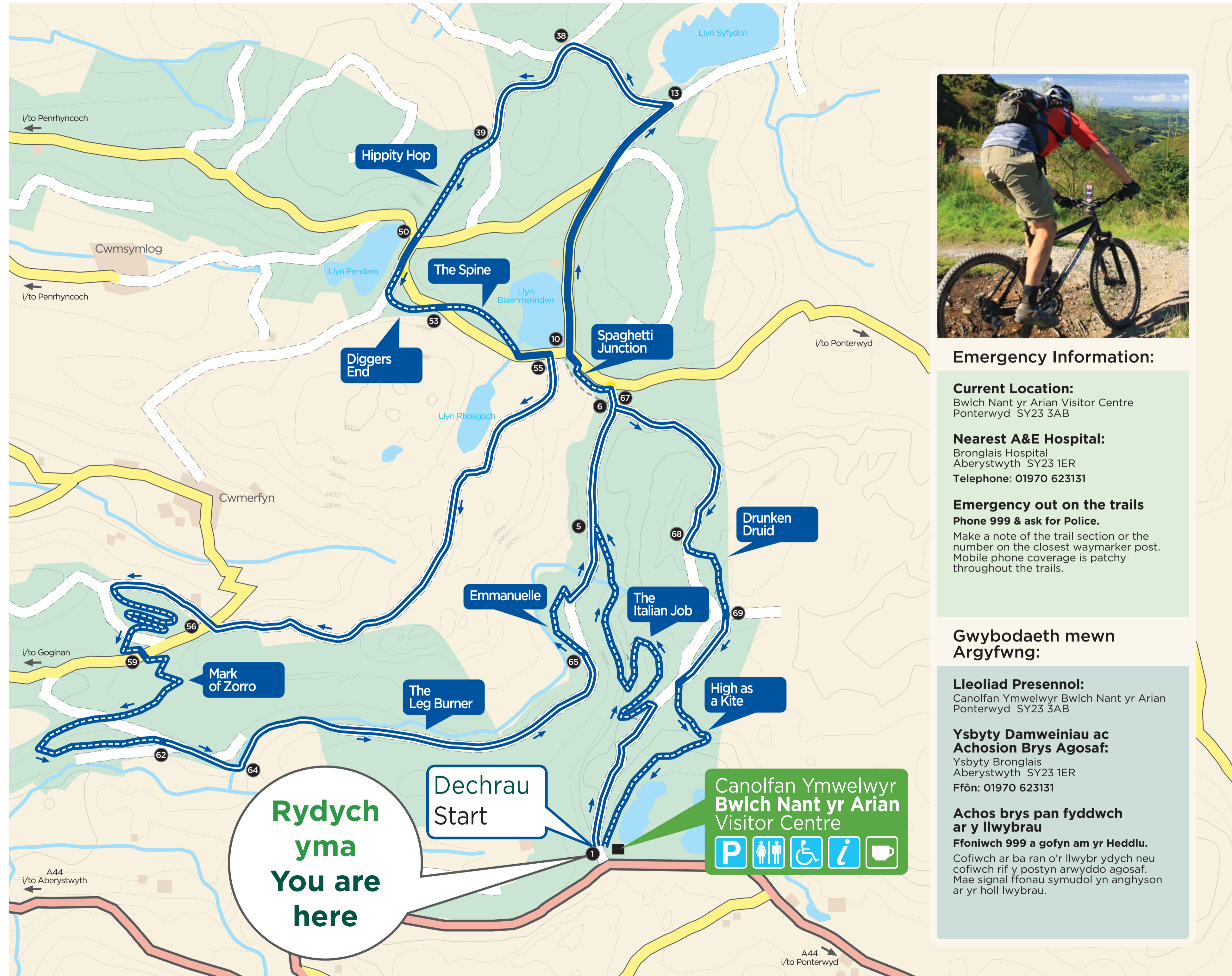
Atgynhyrchir y map hwn o Ddeunydd yr Arolwg Ordnans gyda chaniatâd Arolwg Ordnans ar ran Rheolwr Llyfrfa Ei Mawrhydi Hawlfraint y Goron. © Hawlfraint y Goron a hawliau cronfa ddata 2014 Arolwg Ordnans 100019741, 2014. This map is based upon Ordnance Survey material with the permission of Ordnance Survey on behalf of the controller of Her Majesty's Stationary Office © Crown copyright and database rights 2014 Ordnance Survey 100019741, 2014