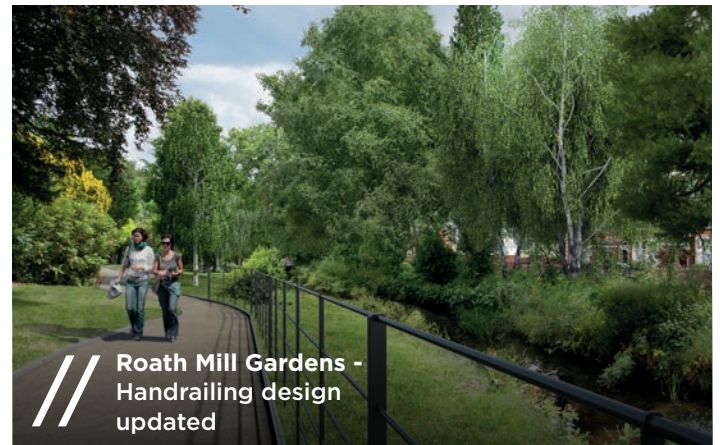
Roath Mill Gardens - Handrailing design updated