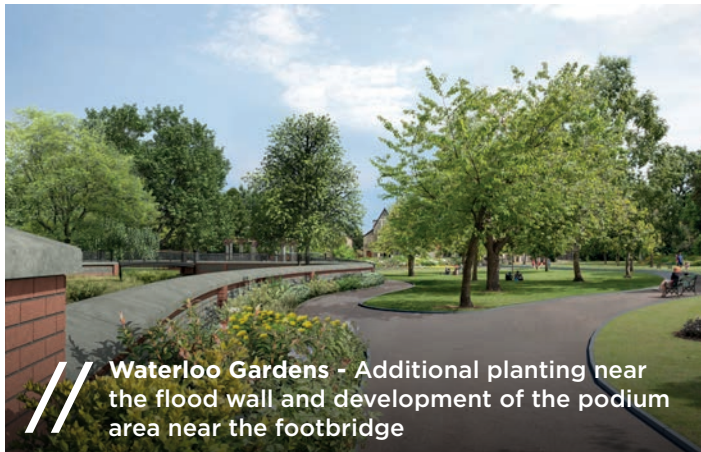
Waterloo Gardens - Additional planting near the flood wall and development of the podium area near the footbridge

Following our last newsletter we have been making minor amendments to the design of the scheme to accommodate the changes made during the design. These include the following: