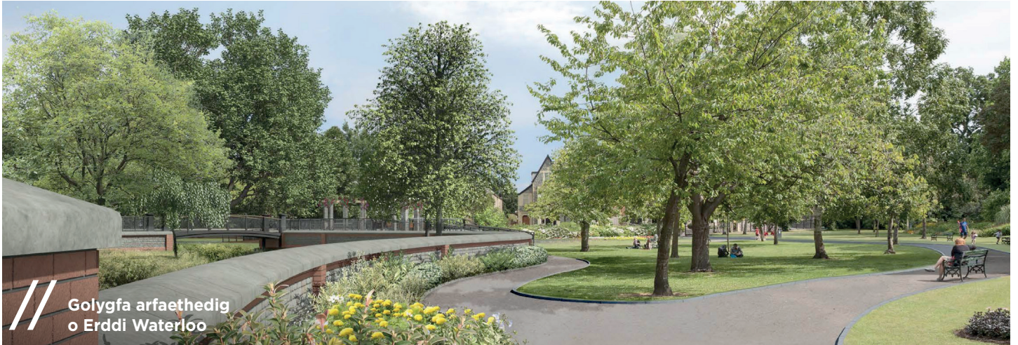
Golygfa arfaethedig o Erddi Waterloo