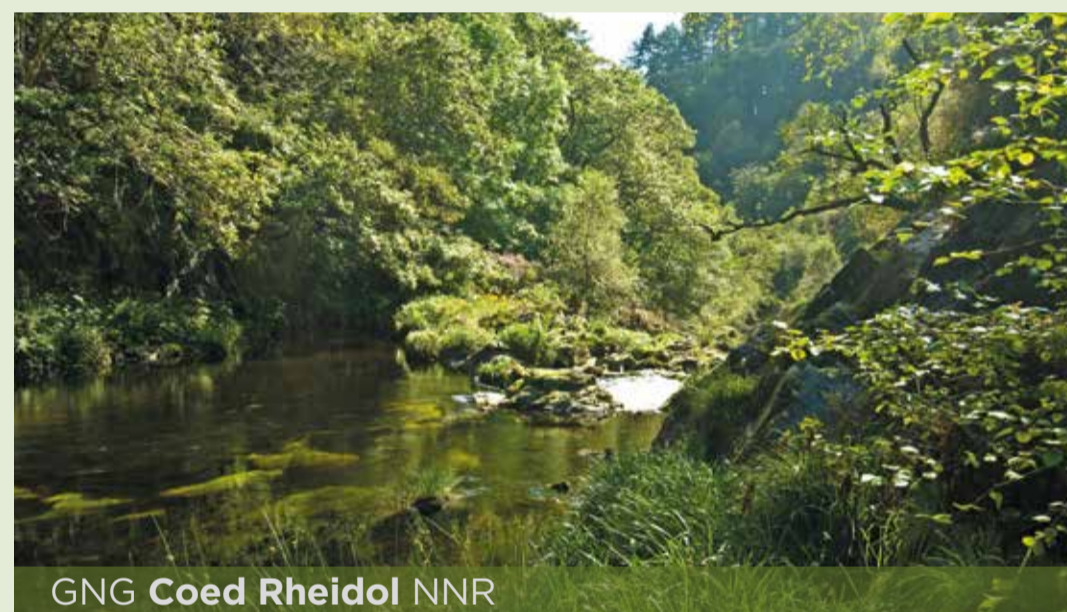
GNG Coed Rheidol NNR

Nodweddion sir hynafol Ceredigion yw ei harfordir trawiadol, tirwedd fynyddig, gwlypdiroedd ardderchog a dyffrynnoedd afonydd dwfn.