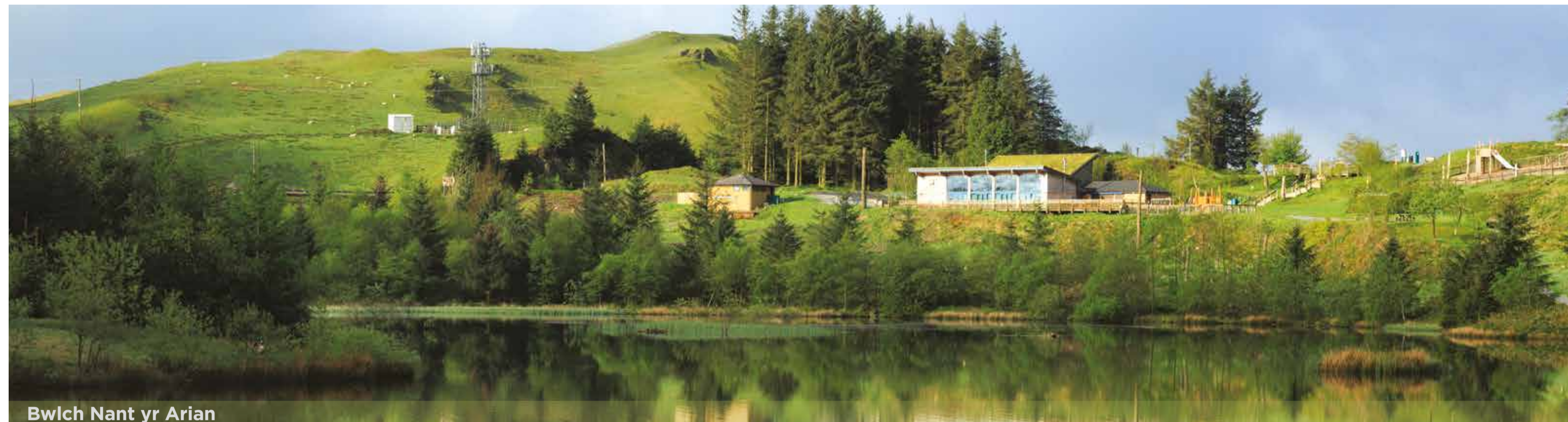
Bwlch Nant yr Arian