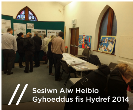
Sesiwn Alw Heibio Gyhoeddus fis Hydref 2014

Rydyn ni'n ddiolchgar iawn i bawb sydd wedi cyflwyno sylwadau ar y cynigion drafft. Ar ôl cynnal y sesiwn alw heibio ac arddangosfa gyhoeddus fis Medi, cafodd sesiwn alw heibio arall ei chynnal ar 7 Hydref oedd yn canolbwyntio'n benodol ar ardaloedd Waterloo a Railway Gardens (Sandies / Minster Gardens).