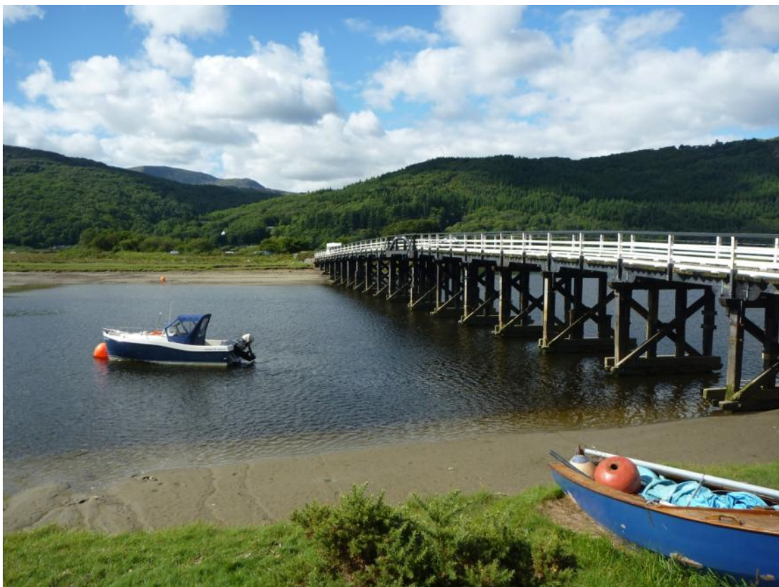
Cynllun Rheoli Basn Afonydd Gorllewin Cymru

Dogfen gwmpasu Aseiad Amgylcheddol Strategol Ymgynghoriad